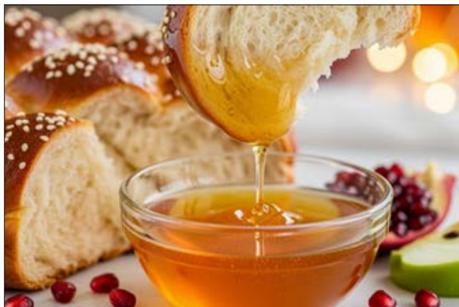
תפילה לשנה טובה ומתוקה ולשנת גאולה וישועה

דווקא במציאות זו חיוני לבצר את חומות האחדות של העם היהודי. השבת נקראת פרשת 'אתם נצבים היום בלכם', המציגה את החלוקות