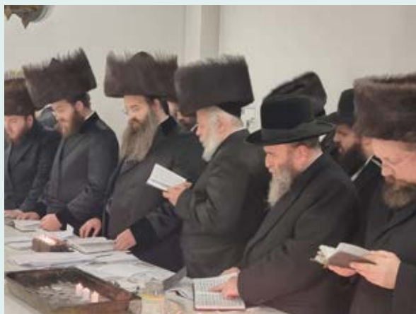
על ציון רבי ישראל מרוז'ין, עם האדמו"ר מסאדיגורא-ירושלים. שני מימין הרב בויאר

אותנו ביום הדין אלא לרומם אותנו. עצם ההזדמנות להיכנס למצב 'איפוס' ולהתחיל הכול מההתחלה צריכה למלא אותנו שמחה.